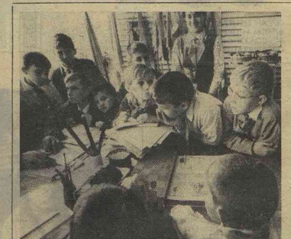
В дружинах, в отрядах приступают к работе новых активистов.

Василис, о тебе говорили пионеры слушали устно. Потому что открылось говорили о поступках своих одноклассников, поступ-